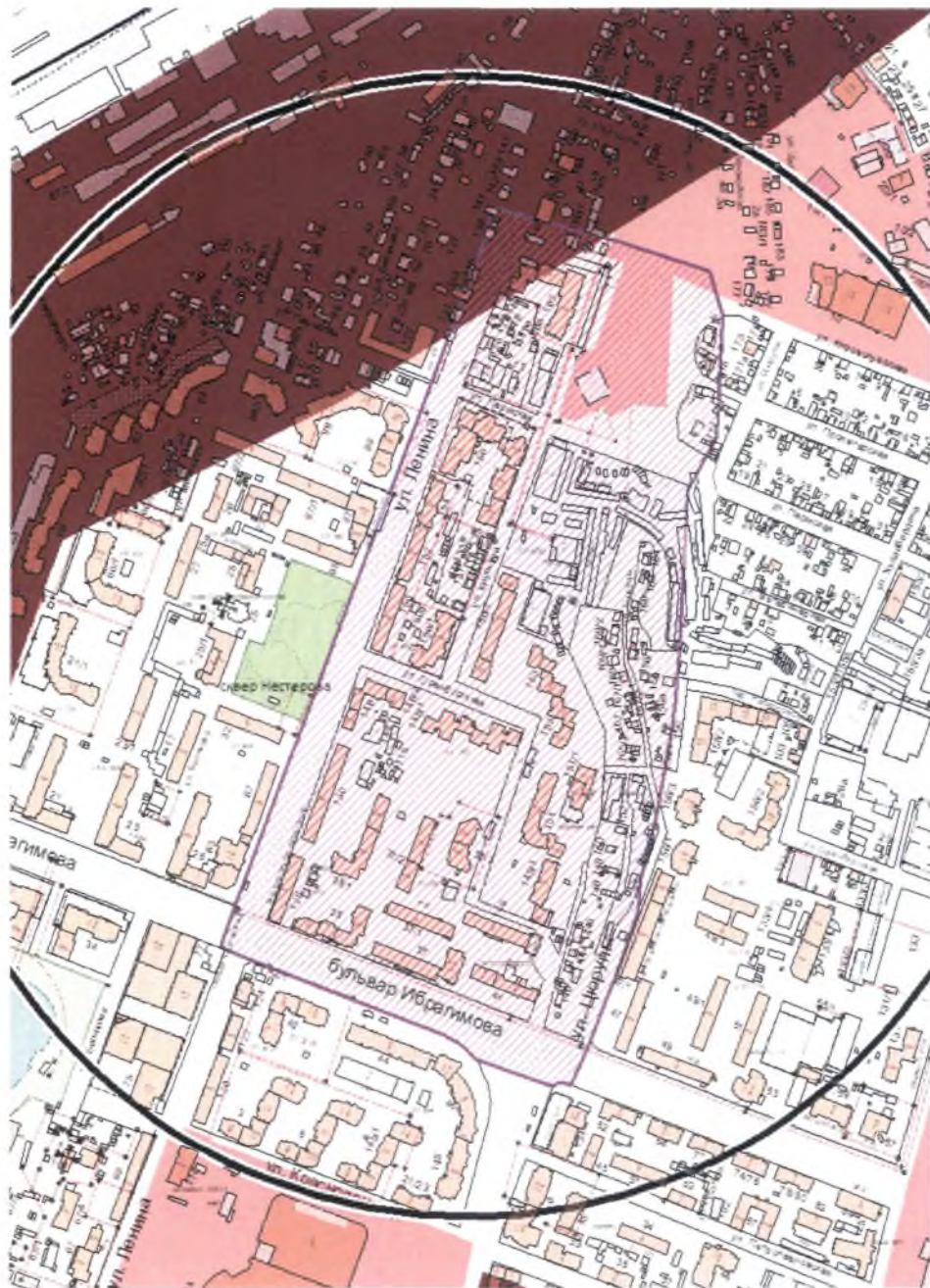
Схема градостроительного регулирования