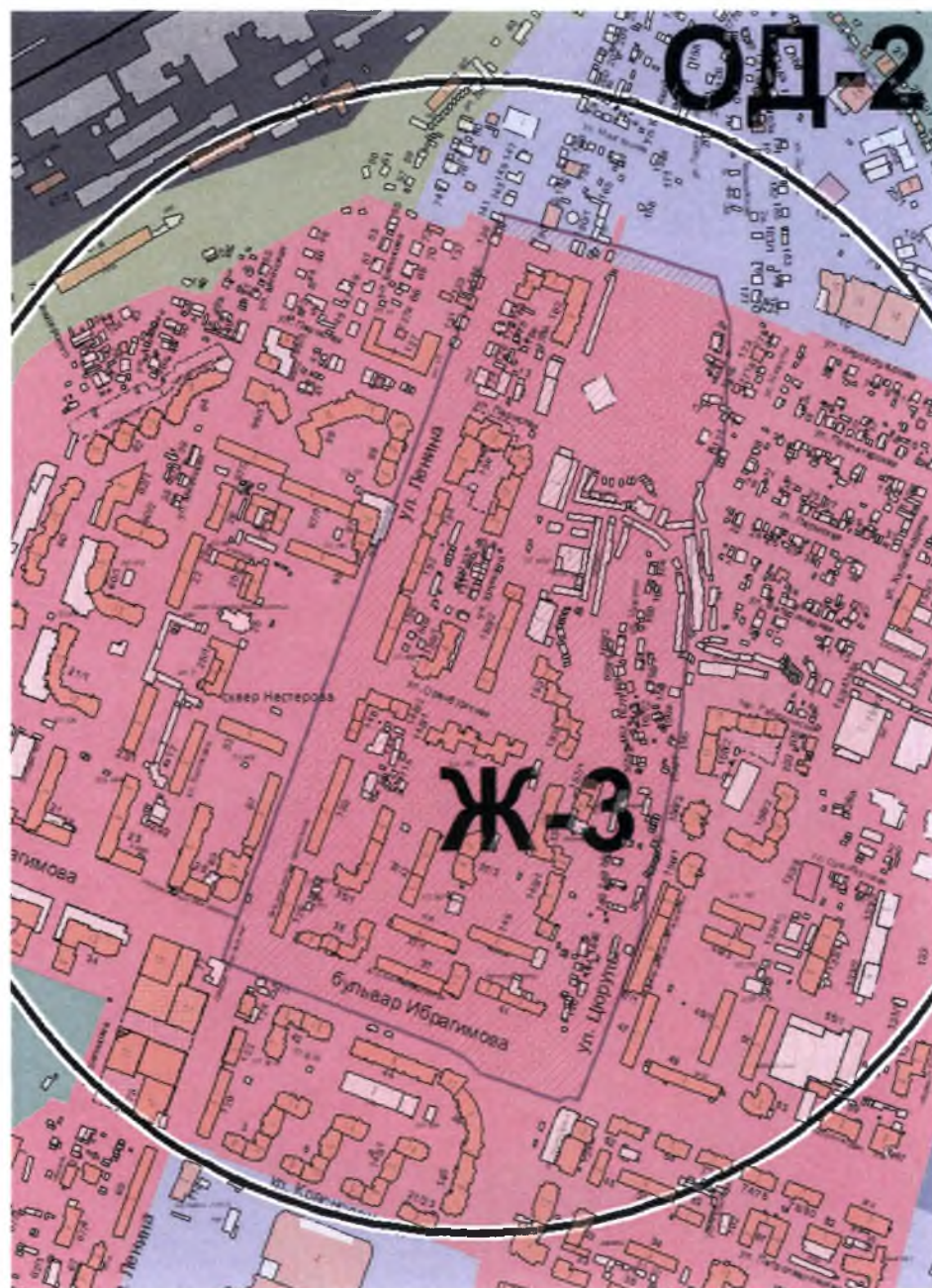
Схема градостроительного зонирования