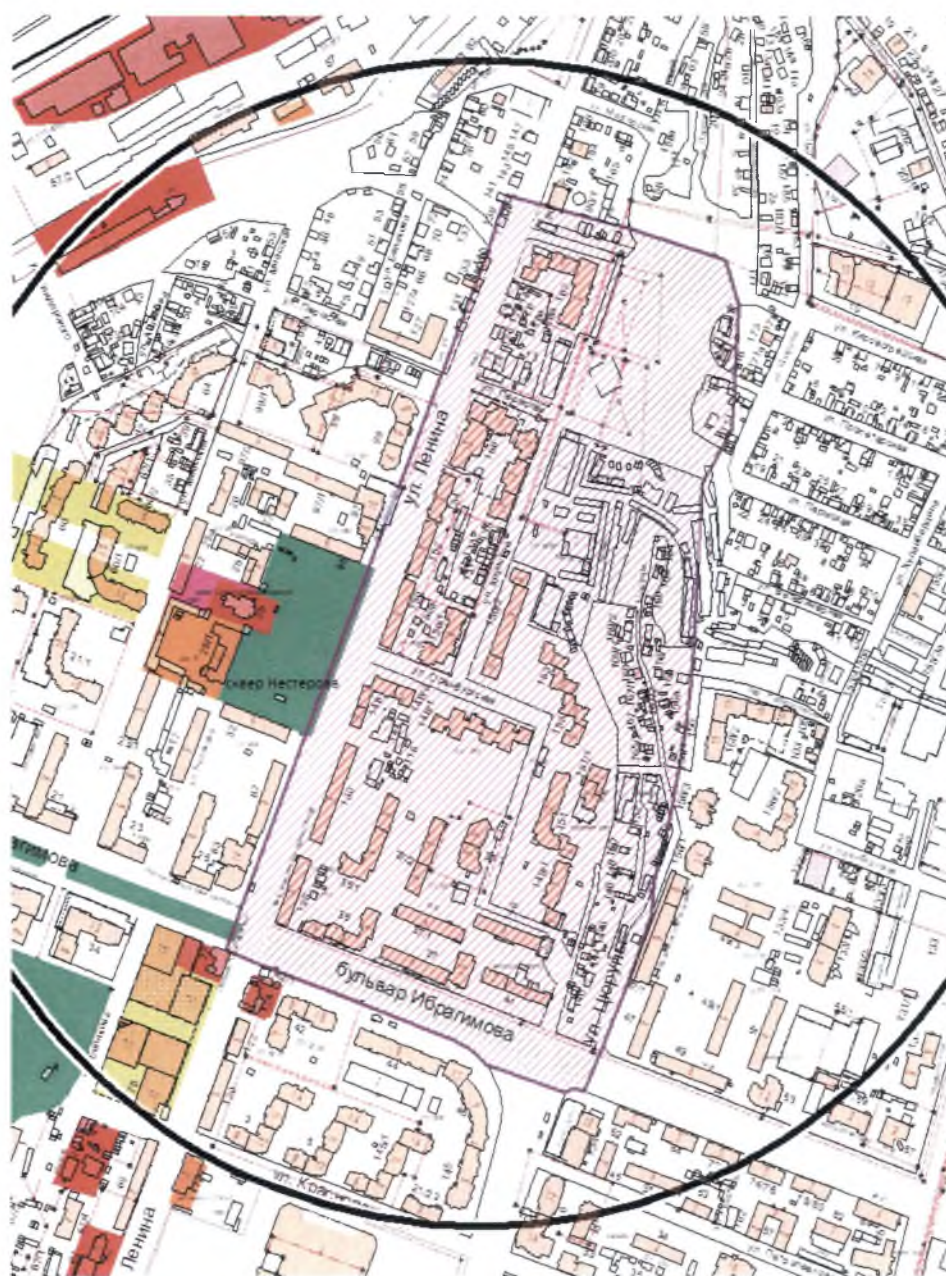
Схема историко-архитектурных ограничений