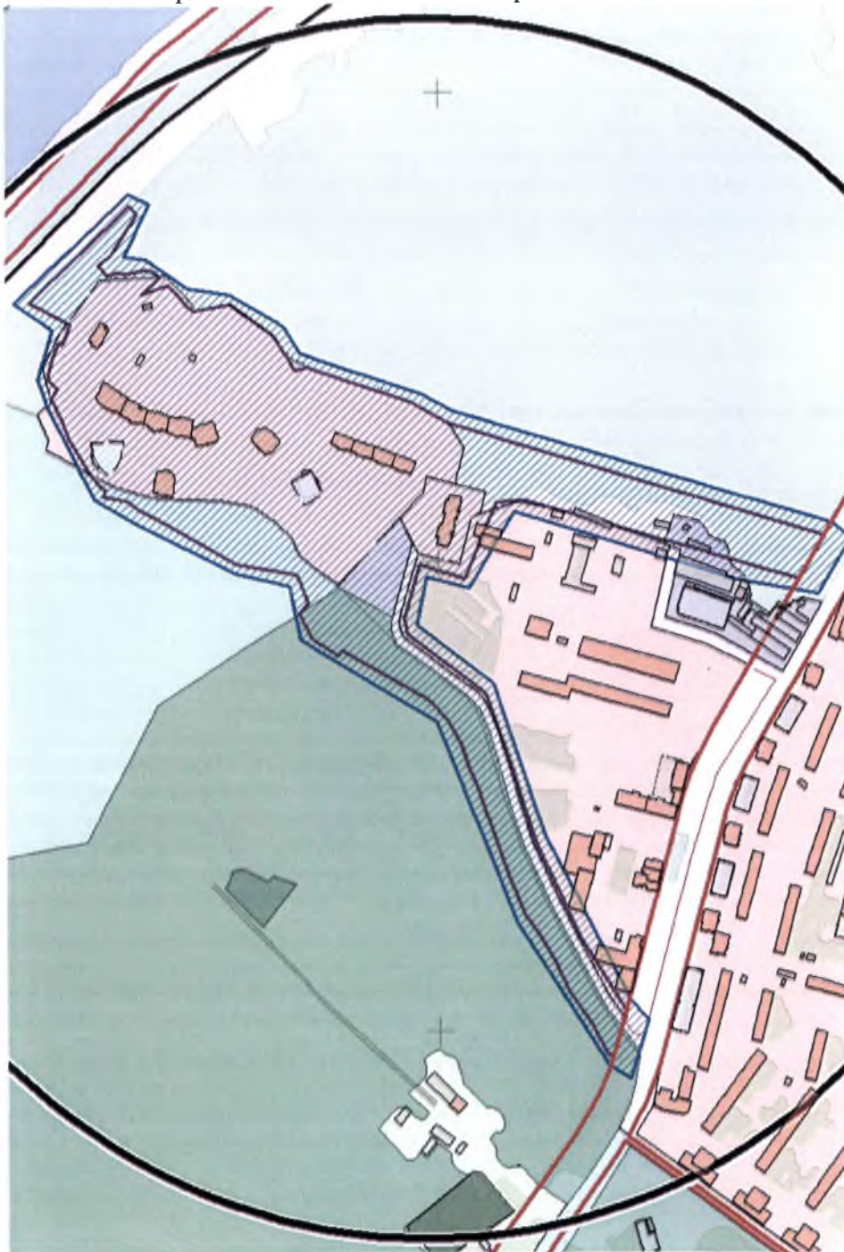
Схема размещения объекта и границ топосъемки