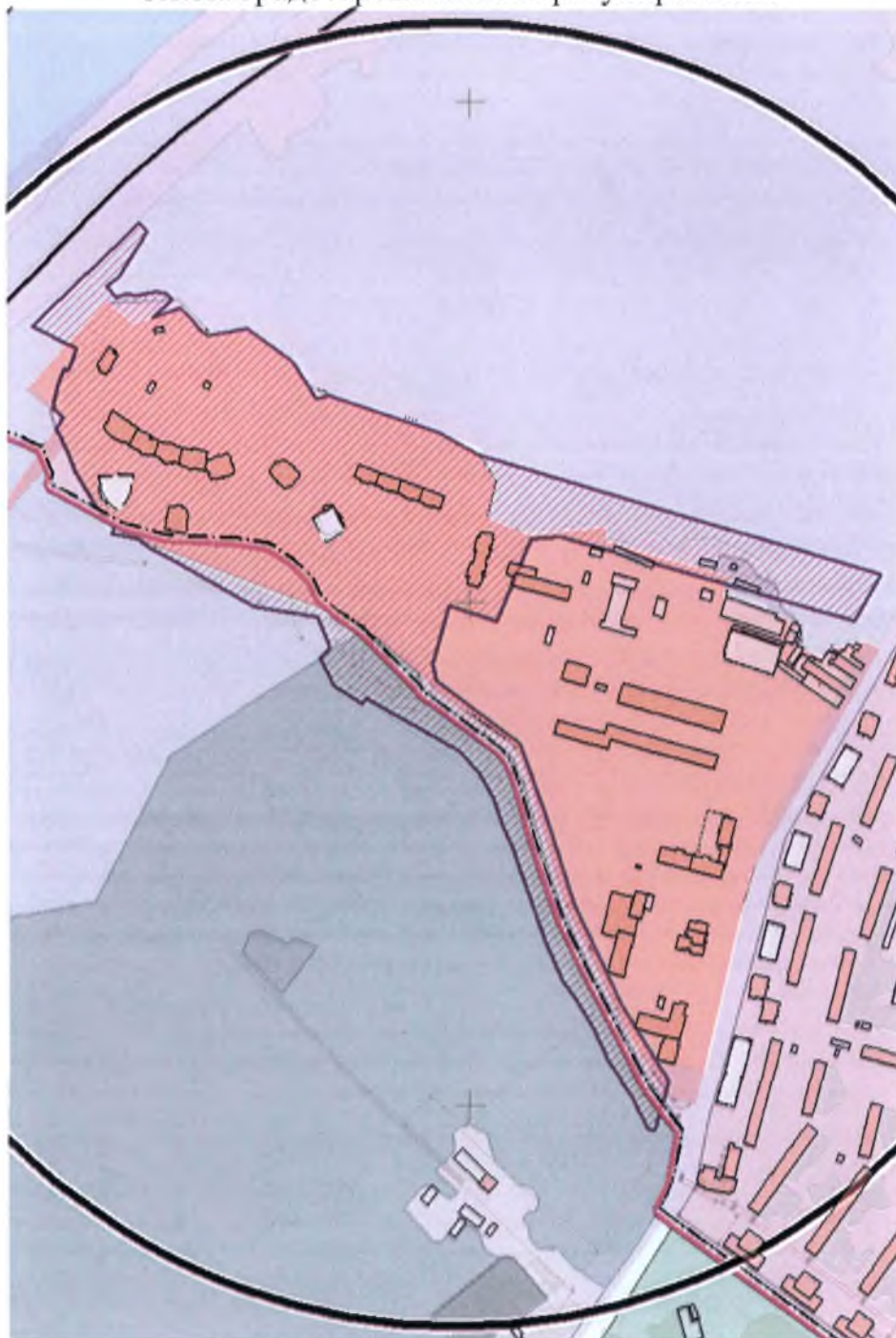
Схема градостроительного регулирования