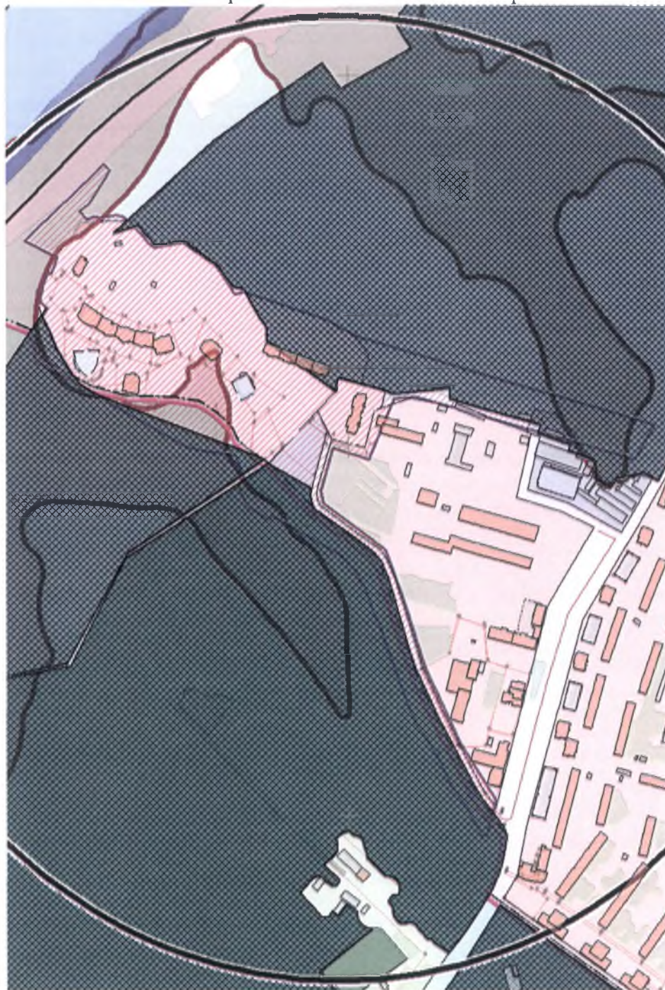
Схема санитарно-экологического зонирования